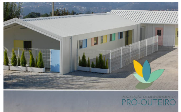
ASSOCIAÇÃO DE MELHORAMENTOS PRÓ-OUTEIRO

Reconstruímos, edificámos e afetámos novos espaços para apoio ao desenvolvimento de atividades e ocupação de tempos livres dos mais jovens.