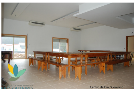
Centro de Dia / Convívio

Tendo em atenção que os investimentos efetuados precisam de proporcionar algum retorno económico e que o adiamento de decisões urgentes nos faz incorrer na deterioração do equilíbrio financeiro que procuramos atingir, consideramos que é urgente uma decisão que vá ao encontro do pedido já efetuado, de modo a não continuar a depender de processos de reestruturação financeira.