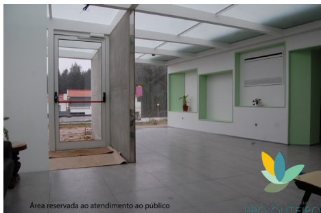
Área reservada ao atendimento ao público