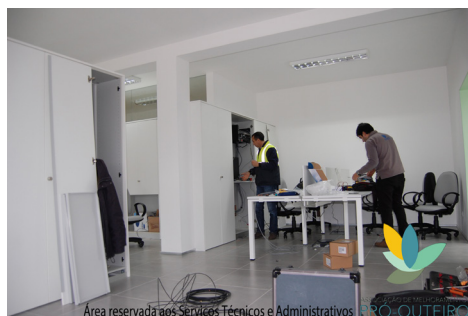
Área reservada aos Serviços Técnicos e Administrativos

Reconfigurámos o edificado no piso inferior, reparámos e reconstruímos para assegurar espaços adequados ao funcionamento de serviços administrativos, de apoio aos funcionários e para assegurar o funcionamento do Centro de Dia e de Convívio.